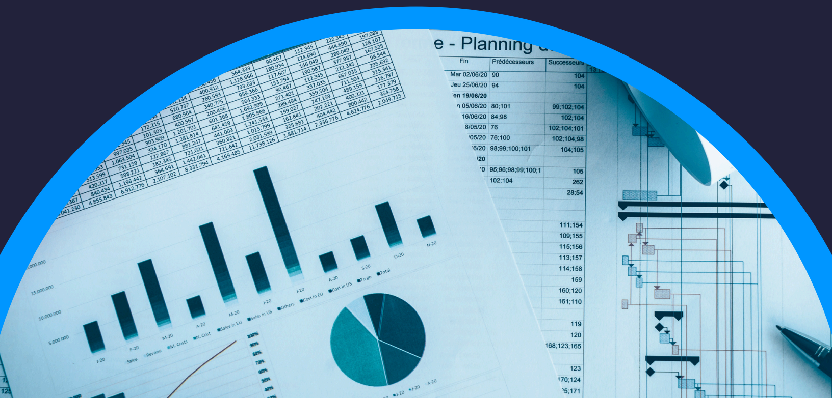
e - Planning